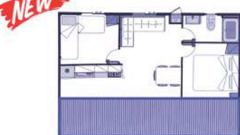
TIPO C EXTRA (4+1)