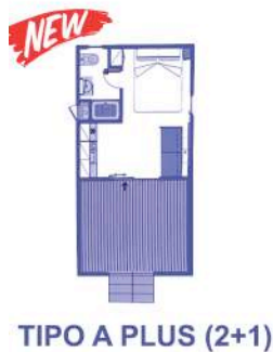
TIPO A PLUS (2+1)