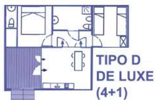
TIPO D DE LUXE (4+1)