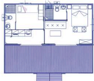
TIPO F Ikhaya (4+1)