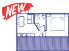
TIPO A (2+1)