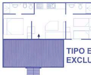
TIPO E EXCLUSIVE