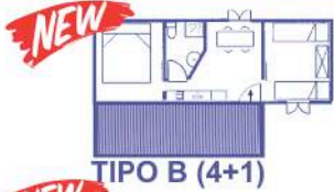
TIPO B (4+1)